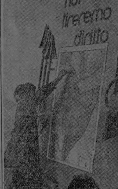
IREMOS DIRECTO La foto demuestra con cuánto interés y entusiasmo siguen los alumnos de las escuelas italianas los progresos de sus fuerzas.

Esta noche hablará por radio WASHINGTON, 3. — Mientras se acerca la hora para que ha sido convocado el Congreso, la atmósfera se llena de cargos y descargos políticos en las proporciones de otras ocasiones cuando la oposición aprovecha el momento propicio para multiplicar sus esfuerzos en contra de la política de la administración que adversan. El anuncio de que el Presidente Roosevelt desea presentar su mensaje anual al Congreso esta noche y propararlo por radio, ha despertado un enorme interés en los círculos de la capital.