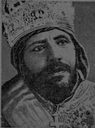
RAS KASSA Otro de los más destacados cabezas de la resistencia etiope, cuyas brillantes acciones ha consignado el cable reiteradamente.