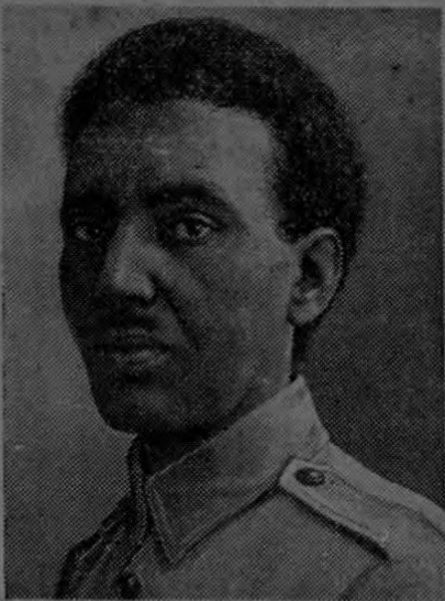
RAS NASIBU El Jefe superior abisinio en el frente sur, quien está ordenando la desocupación de Rarrar, en previsión de un ataque aéreo.