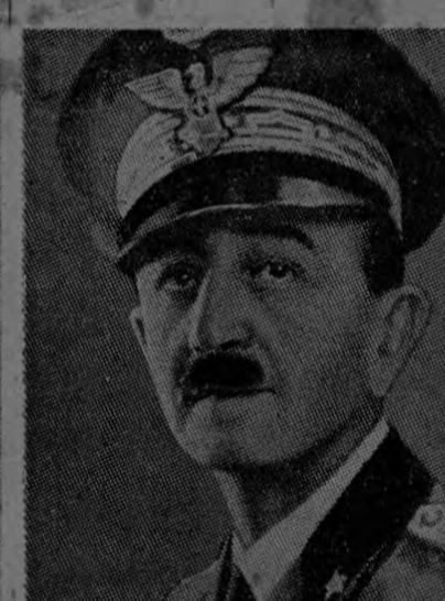
GENERAL MARAVIGNA Quien ha actuado brillantemente en el mando del flanco derecho de las tropas italianas en el norte etíopico.