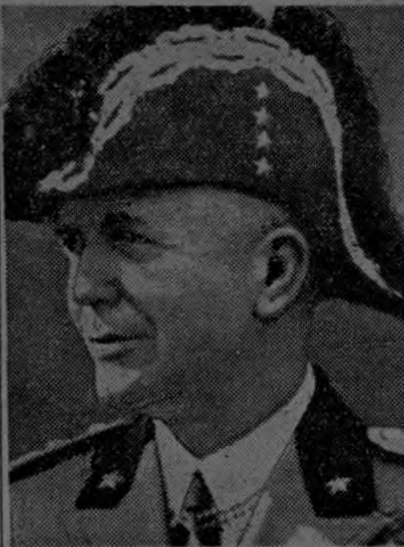
MARISCAL BADOGLIO El hombre que inspira la máxima confianza al pueblo italiano, por su larga experiencia en luchas coloniales.